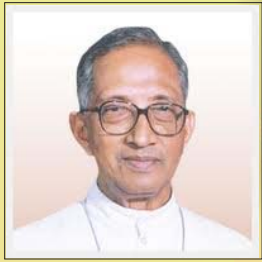
ആർച്ച് ബിഷപ്പ് മാർ ജോസഫ് പവുത്തിൽ