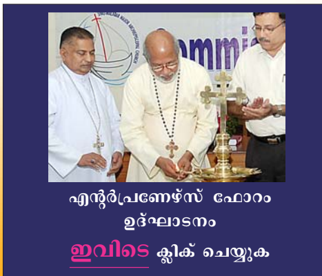
എൻ്റർപ്രണേഴ്സ് ഫോറം ഉദ്ഘാടനം ഇവിടെ ക്ലിക്ക് ചെയ്യുക